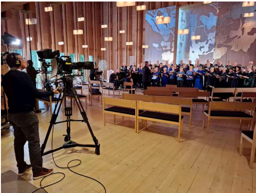
Gamelikören, inspelning i Viks kyrka.

“Var inte rädd för mörkret. Det kanske vill dig väl”