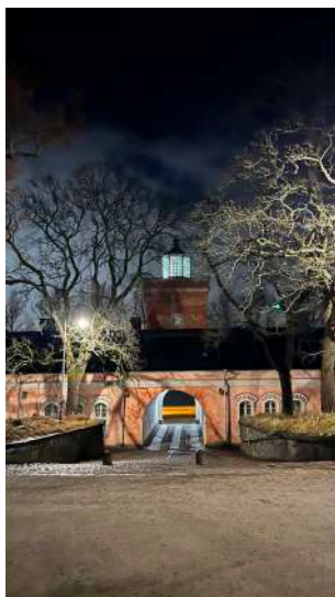
PÄRMBILD: Sveaborg.