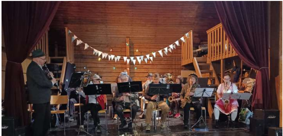
Blåsorkestern Tonvirveln uppträder på Oktoberfesten.